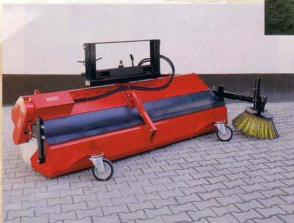
Kehrmaschine mit Seitenbesen