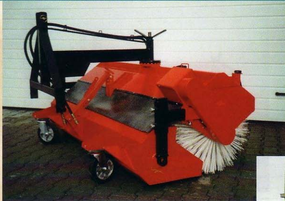
Kehrmaschine in Grundausrüstung