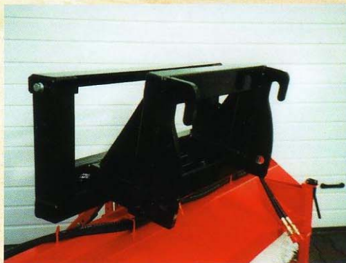
Radlader-Anbau mit Pendelausgleich

Alle Abbildungen, Maße und Gewichte sind unverbindlich, Konstruktionsänderungen vorbehalten