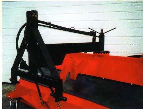
Dreipunkt-Anbau ohne Seitenverstellung mit Schrägstellung