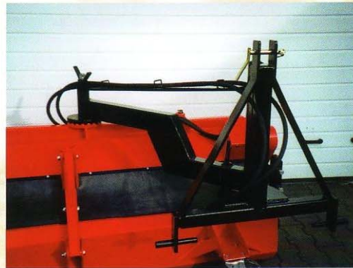
Dreipunkt-Anbau mit Seitenverstellung mit Schrägstellung